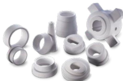
Nozzles / Bushes