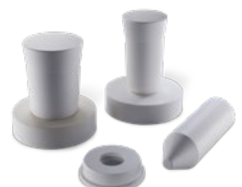
Stoppers / Plates