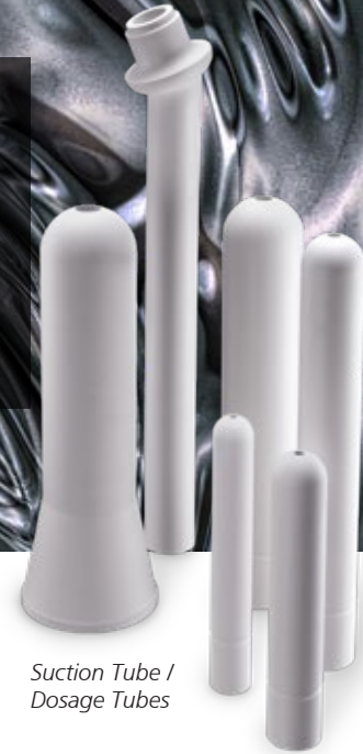
Suction Tube / Dosage Tubes