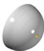
Hole in apex